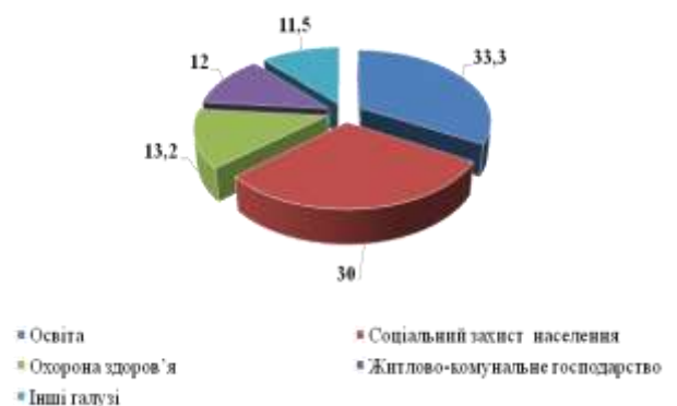
Структура видатків міського бюджету, %

Видатки міського бюджету за січень-жовтень 2018 року склали 2439,8 млн. грн., що на