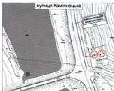
СХЕМА ВСТАНОВЛЕННЯ ДОРОЖНІХ ЗНАКІВ щодо обмеження руху транспортних засобів у зв'язку з підвищенням температури повітря