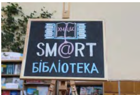
Фото реалізації проекту