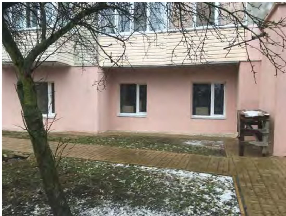
Фото реалізації проекту