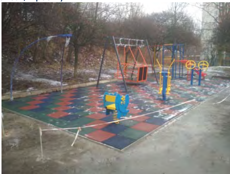
Фото реалізації проекту