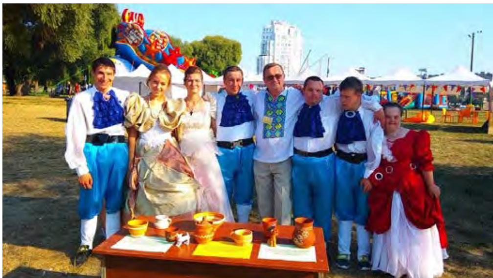
Фото реалізації проекту

Проект - фестиваль творчості дітей та молоді з особливими потребами «Сяйво дитинства» реалізовано у рамках фестивалю «RESPUBLICA», який відбувся на території Молодіжного парку 30 серпня – 1 вересня 2019 року. Брала участь понад 70 учасників з різних міст України. За майстерність та яскравість таланту учасники заходу одержали дипломи та подарунки.