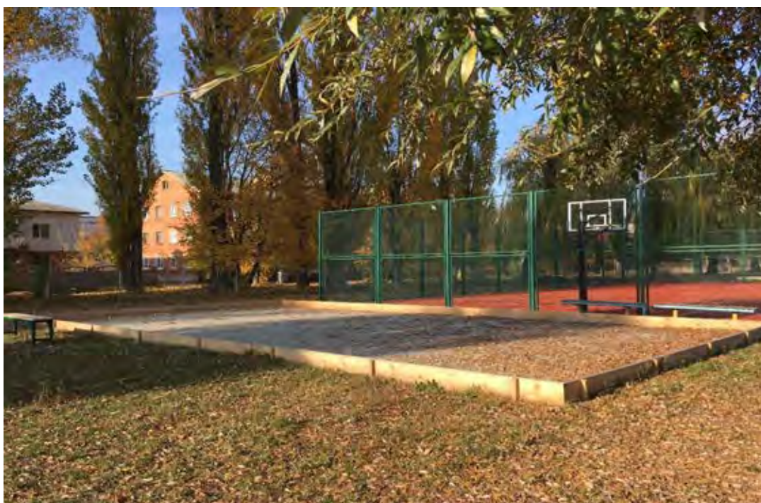
Фото реалізації проекту