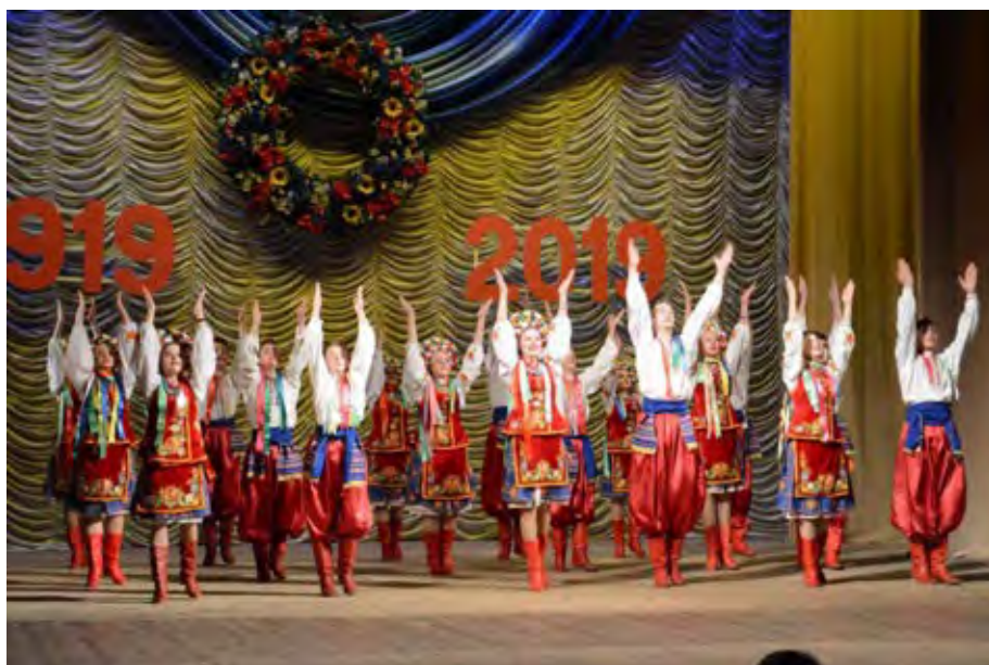
Фото реалізації проекту