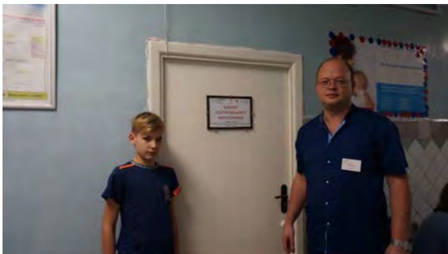
Фото реалізації проекту