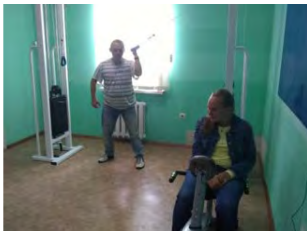
Фото реалізації проекту