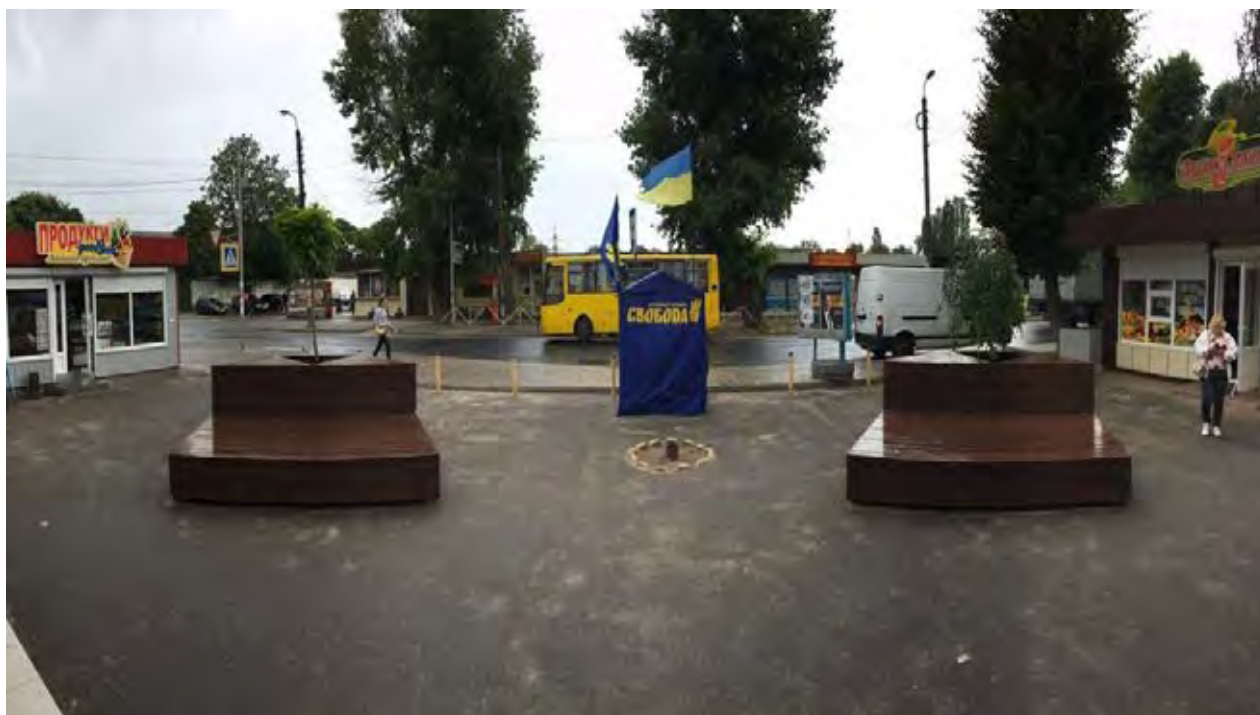
Фото реалізації проекту