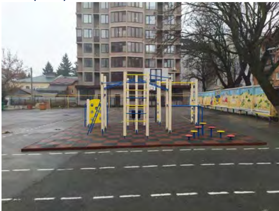
Фото реалізації проекту