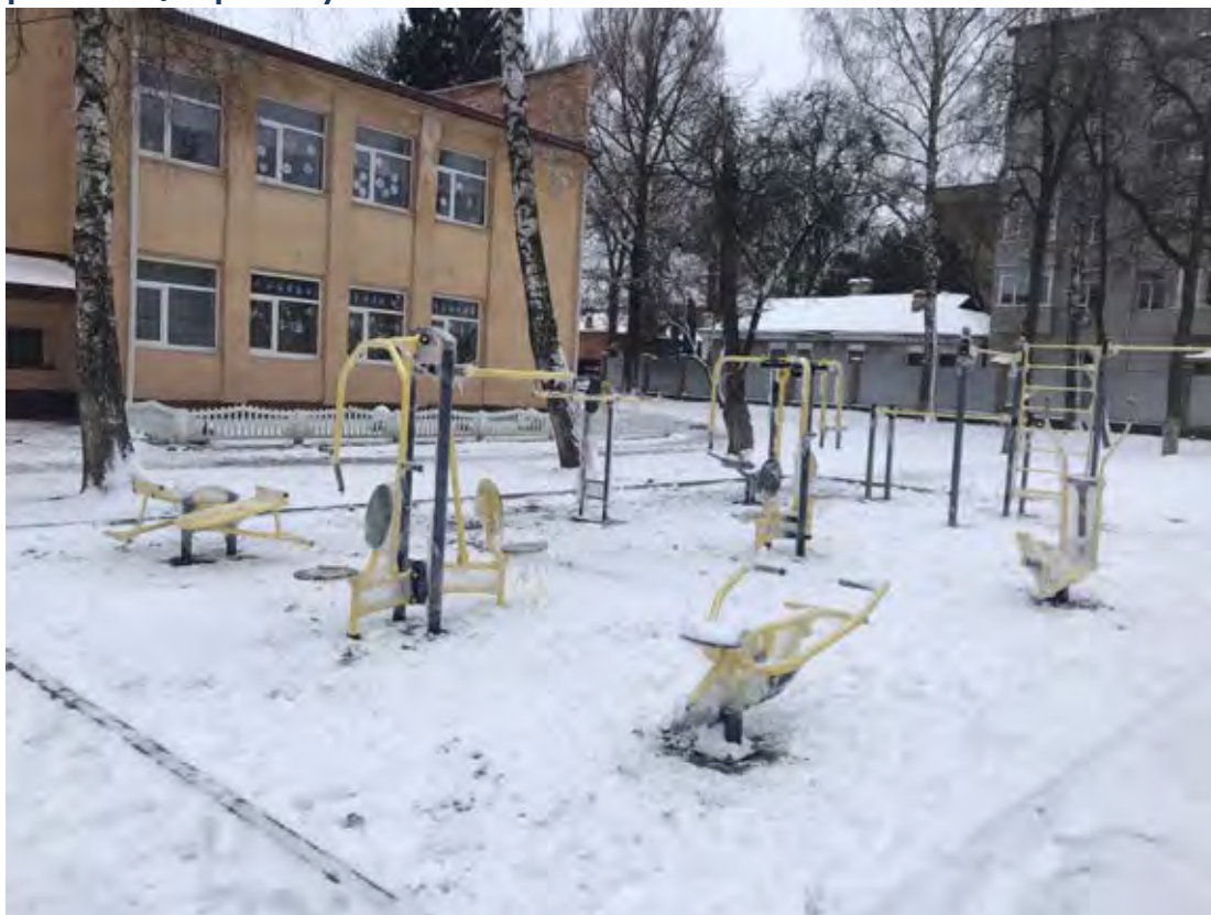
Фото реалізації проекту

Придбано обладнання та облаштовано спортивний майданчик.