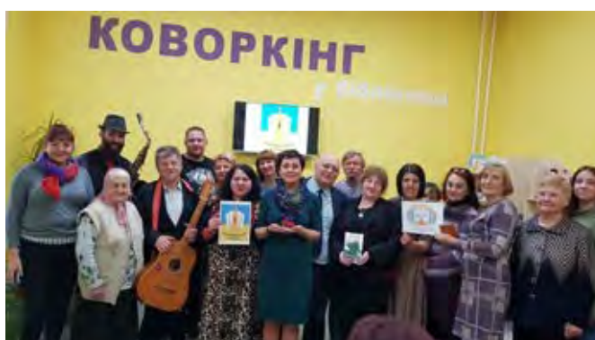
Фото реалізації проекту