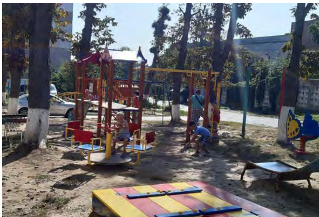
Фото реалізації проекту

Облаштовано новий дитячий майданчик та створено умови для якісного дозвілля дітей.