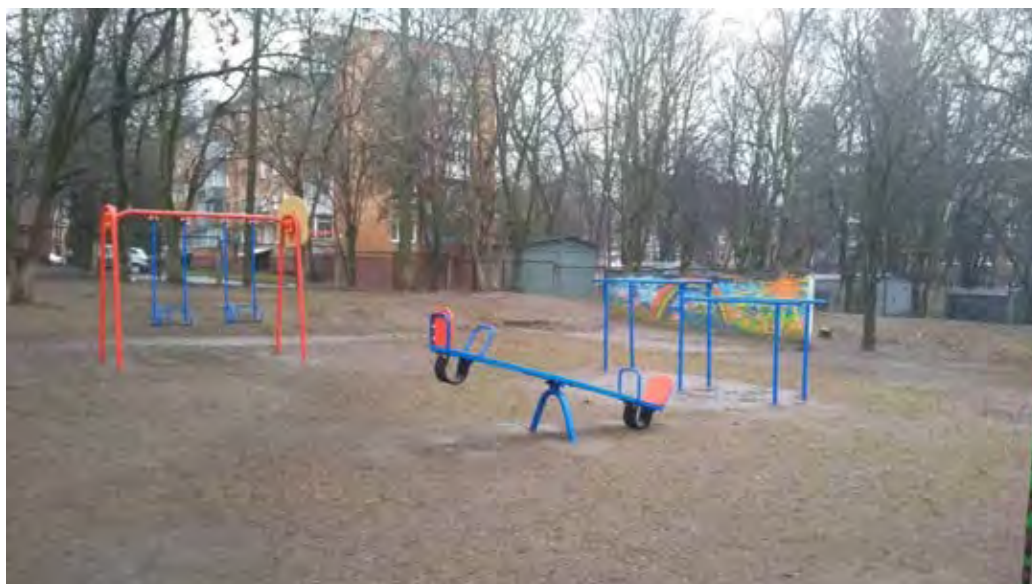
Фото реалізації проекту