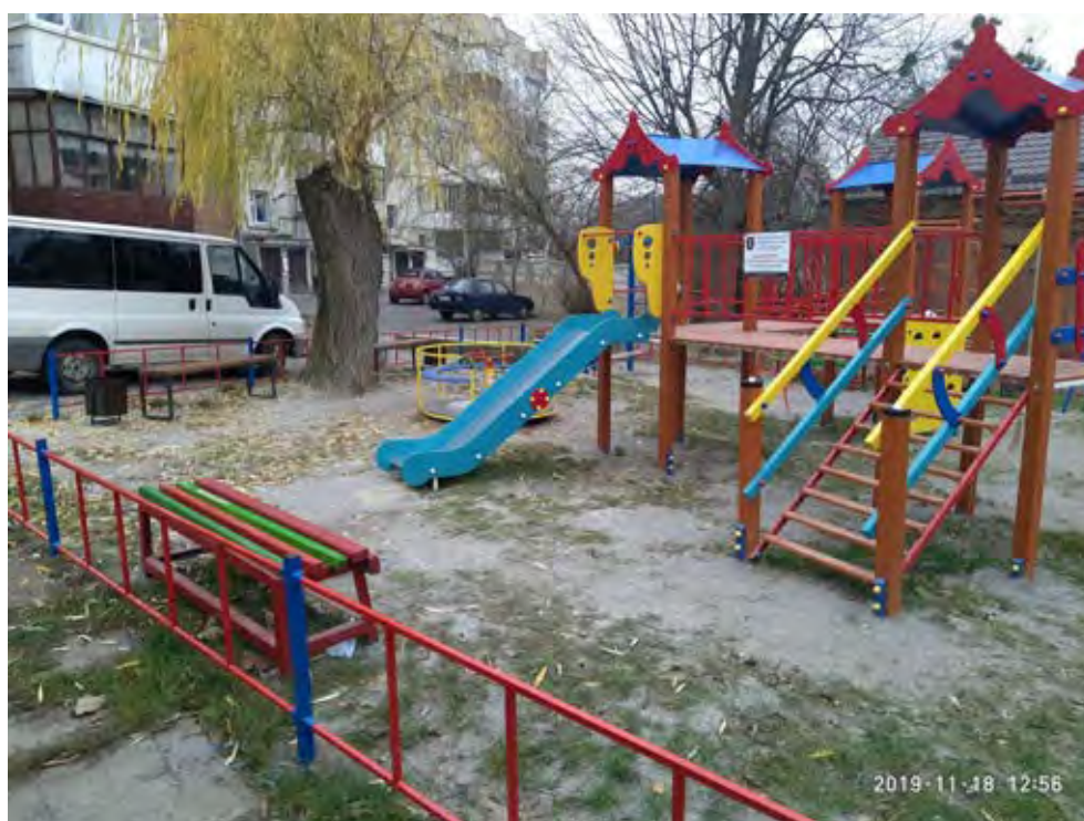
Фото реалізації проекту