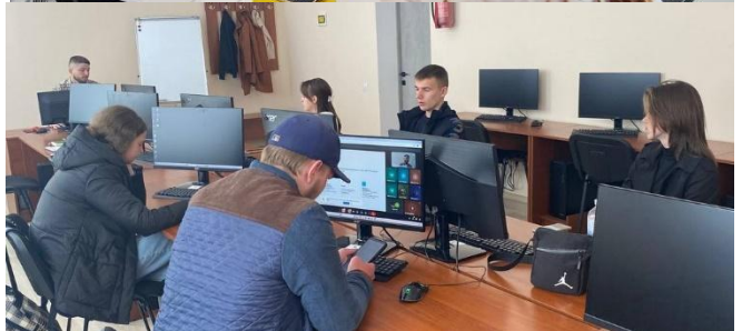
В і відкритих даних».