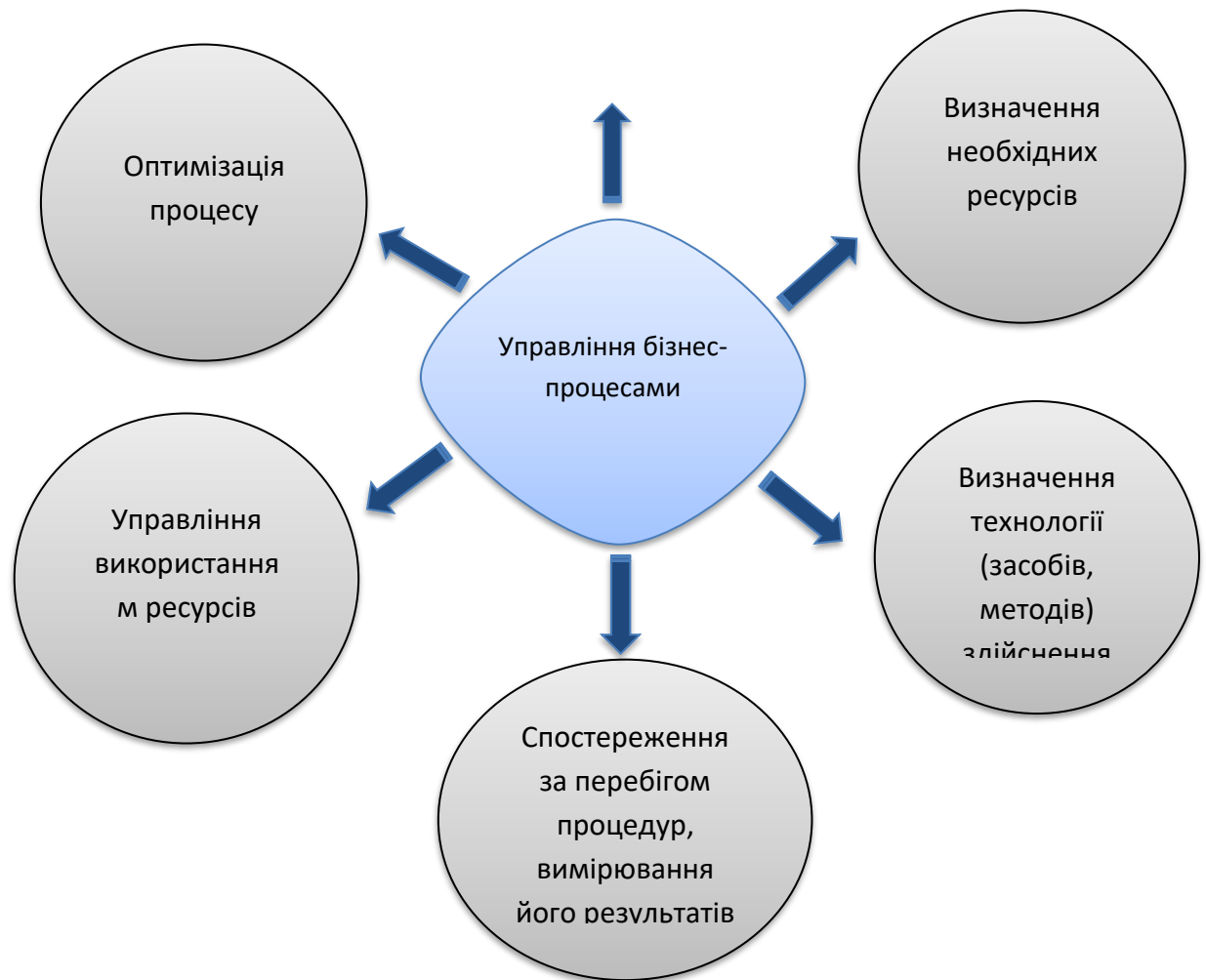
Рис. 3. – Схема управління бізнес-процесами підприємства

Оптимізація бізнес-процесів – це безпосереднє розроблення та реалізація заходів щодо вдосконалення бізнес-процесів підприємства для досягнення позитивного ефекту в зміні якісних показників діяльності підприємства.